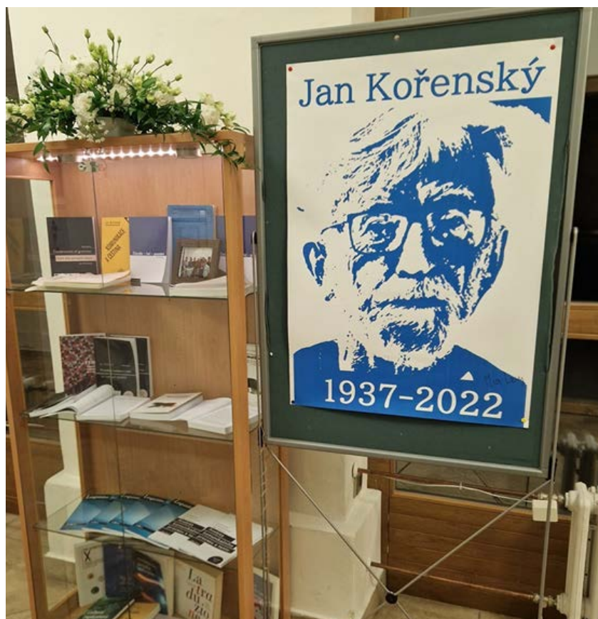
Figure 3: Knihovna Jana Kořenského umístěna v prostorách ISI (International Semiotics Institute) na Univerzitě Palackého v Olomouci.